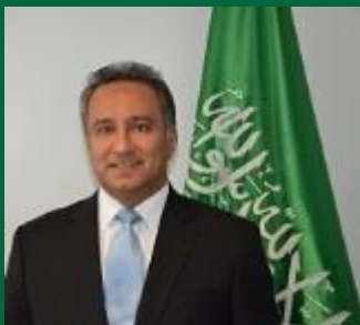
Abdulrahman S. Alahmed

De status van vrouwen in het algemeen is door de jaren heen zeer sterk verbeterd in Saoedi-Arabië en het Koninkrijk heeft onlangs nieuwe wetten en regelgeving aangenomen met betrekking tot de zelfbeschikking van vrouwen. We kijken ernaar uit om nog grotere vooruitgang te boeken op dit gebied in een tempo dat onze waarden weerspiegelt.